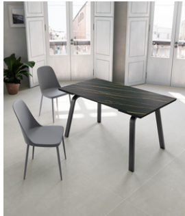
Dylan (OM/404/MN) Tavolo Allungabile (140/ 200 x 80 cm)