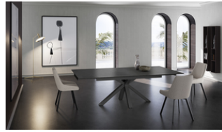
Ceramica 1 (OM/313/GR) Extendable Table(160/240 x 90 cm)