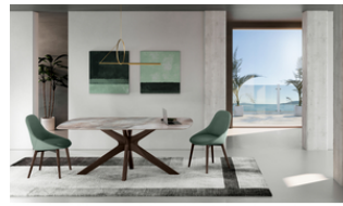
Gemini (OM/438/AL) Fixed table (180 x 90 x 76 cm)