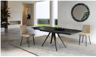
Kyoto 140 (OM/326/PO)

Tavolo allungabile con top in ceramica. Gambe in metallo verniciato. Allunghe interne.