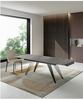
Match 1 (OM/435/MG) Tavolo allungabile (160/240 x 90 cm)