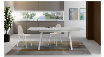
Dylan (OM/404/MB) Tavolo Allungabile (140/ 200 x 80 cm)