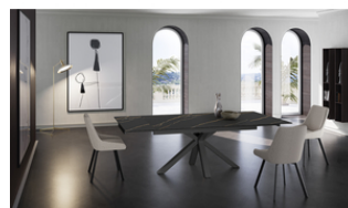
Ceramica 1 (OM/313/MN) Extendable Table(160 / 240 x 90 cm)