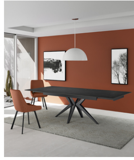
Match 2 (OM/436/MN) Tavolo allungabile (160/240 x 90 cm)