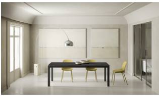
Account 24 (OM/322/PO)