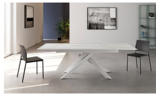
Ares (OM/452/BI) TAVOLO ALLUNGABILE

Tavolo allungabile con top in ceramica su vetro. Gambe in metallo verniciato Bianco. Allunghe interne.