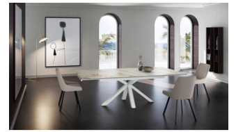
Ceramica 1 (OM/313/MC) Tavolo allungabile (160/240 x 90 cm)