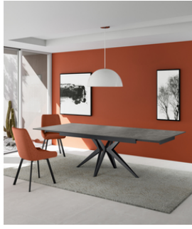
Match 2 (OM/436/MG) Tavolo allungabile (160/240 x 90 cm)