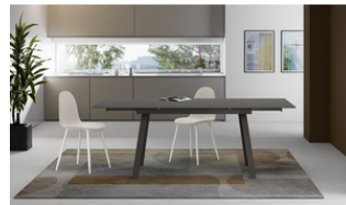
Dylan (OM/404/MG) Tavolo Allungabile (140/ 200 x 80 cm)