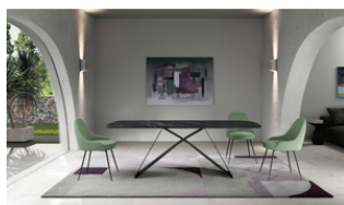
Thanos (OM/398/MN) Fixed table (220 x 110 cm)