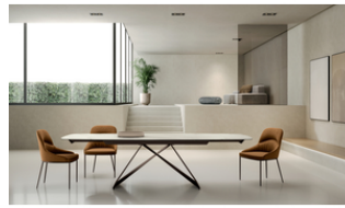
Thanos X (OM/465/MC)

Tavolo allungabile con top in ceramica su vetro. Gambe in metallo verniciato Nero. Allunghe interne in ceramica.