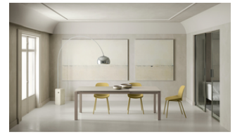
Account 24 (OM/322/SA)

Tavolo allungabile con top in ceramica su vetro. Gambe in metallo verniciato Bronzo. Allunghe interne in ceramica.