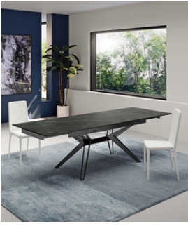
Match 3 (OM/437/MN) Tavolo allungabile (160/240 x 90 cm)