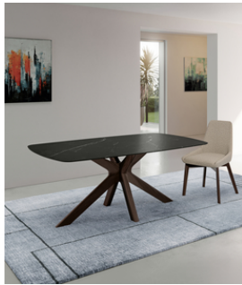
Gemini (OM/438/MN) Fixed table (180 x 90 x 76 cm)