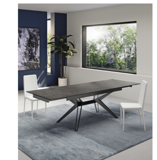
Match 3 (OM/437/MG) Tavolo allungabile (160/240 x 90 cm)