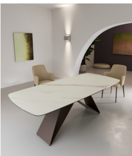
Thanos (OM/398/MC) Tavolo fisso con top in ceramica su vetro. Gambe in metallo verniciato Bronzo.