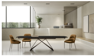
Thanos X (OM/465/MN)

Tavolo allungabile con top in ceramica (sinthered stone). Gambe in metallo verniciato. Allunghe interne in ceramica.