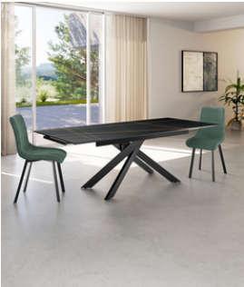
Ares (OM/452/NE) Tavolo allungabile (140/200 x 80 cm)