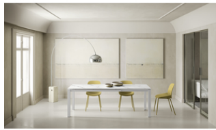
Account 24 (OM/322/MB)