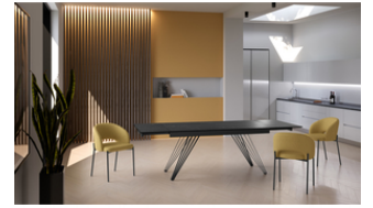
Match 1 (OM/435/MN) Tavolo allungabile (160/240 x 90 cm)